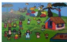
Creche Nossa Senhora Aparecida – Pantanal