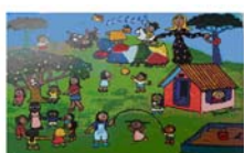
Creche Nossa Senhora Aparecida - Pantanal